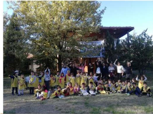
Okulöncesi Öğrenci Eğitimi Sonrası Doğa Kâşifleriyle Veda Fotoğrafı

Projenin Web Sitesi → https://www.tubitak-4004agacbilimokulu.com/ , Facebook Grubu → https://www.facebook.com/groups/800396916703142/ , ve Instagram Hesabı → ( https://www.instagram.com/tubitak-4004agacbilimokulu/ )