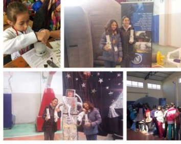
Keçiören-Şehit Ahmet Özsoy Kız İHL